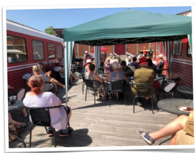
Fra sommerfesten 2019

Julemarkedet 2022 holdes lørdag den 26. november